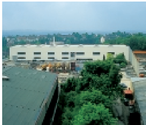
Just-in-time-Logistik für den reibungslosen Fortschritt am Bau.