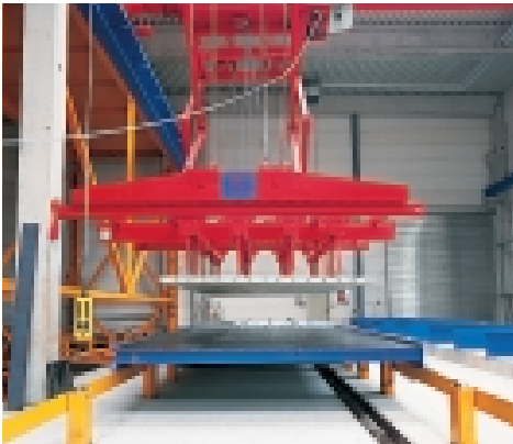
Modernste Umlaufanlagen für wirtschaftliche Vorfertigung im Syspro-Werk.

Kurze Wege sind ein weiteres wichtiges Qualitätsmerkmal der Syspro-Gruppe. Eines der Syspro-Mitgliedswerke ist auch bestimmt in Ihrer Nähe. Und damit das umfassende Serviceangebot, die hochwertige Produktpalette und die perfekte Logistik, die Ihren Erfolg unterstützen. Je früher Sie unsere Spezialisten in Ihre Planungen einbinden, um so wertvoller ist ihr Beitrag für das gemeinsame Ziel: das wirtschaftliche Bauen ohne Abstriche bei der Qualität. Wann starten Sie mit uns in die neue Dimension des Bauens?